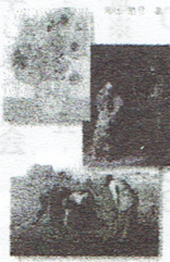
信仰の眼で読み解く絵画